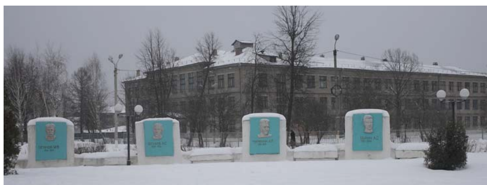
Площадь Победы. Кировчане-Герои Советского Союза.

11 января - День освобождения города Кирова от немецко-фашистских захватчиков