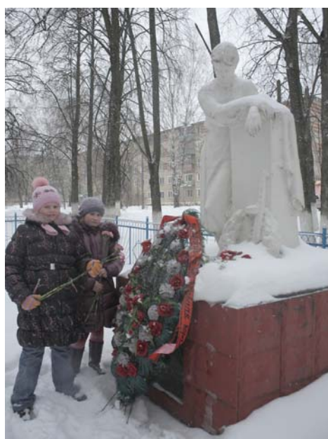
Сквер школы №2.