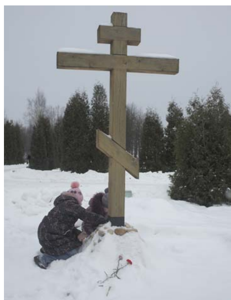
Поклонный крест на площади Победы.