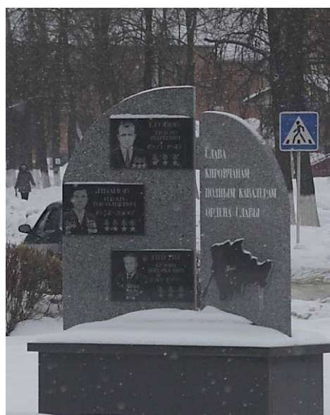
Площадь Победы. Памятник кировчанам-кавалерам ордена Славы.