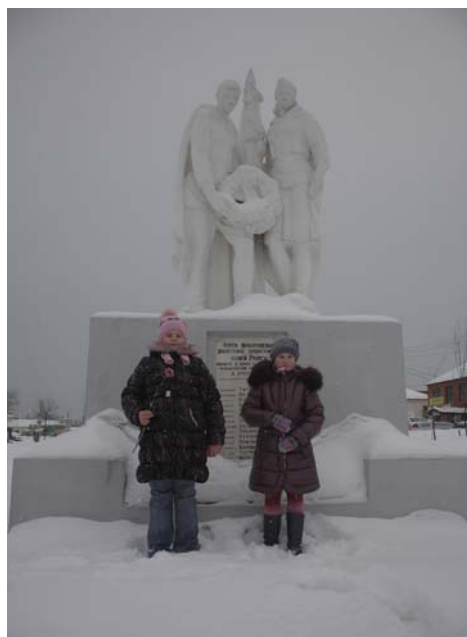
Сквер имени П. Самусенко.

Сначала ребята побывали в сквере школы №2. Могила была занесена снегом. Девочки очистили венок от снега и прочитали надпись, кто там похоронен. Здесь похоронены: "Доблестные защитники нашей Родины, павшие в боях с немецко-фашистскими захватчиками в Январе 1942 году". В Книге памяти Кировского района" написано, что всего в могиле покоится прах 207 воинов.