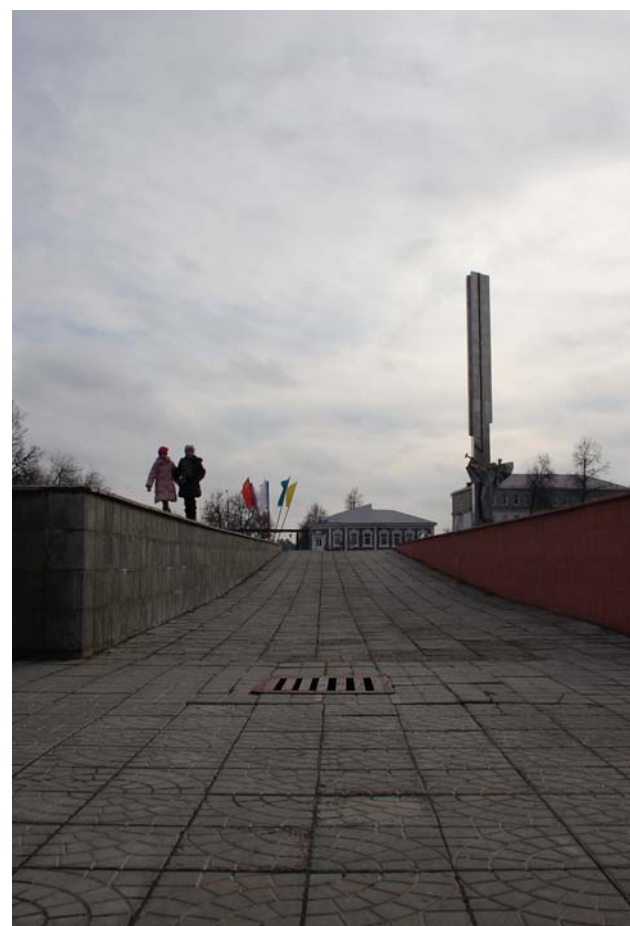
Вера Сапогова. «На площади Победы!».