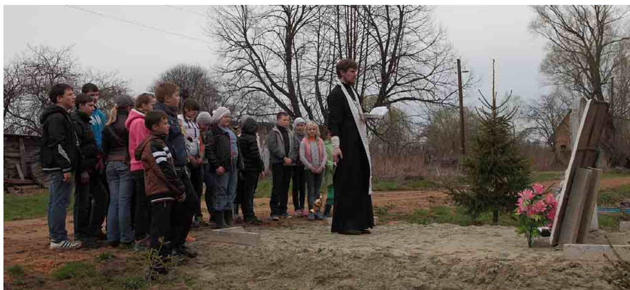
Материал подготовили к публикации Ирина ПАХУНОВА, Денис АНДРИЯНОВ, Аня БЕЗЗУБОВА.

Потом мы пошли в деревню Дмитровка. Мы пошли на большую могилу, где мы потом обедали. Ели мы там огурцы, картошку, помидоры и яблоки. Потом произнесли литию за усопших, и пошли в Панский на могилу. Потом пошли через поле на дорогу. Тут у нас возникли трудности. Вдруг на нас стали забираться клещи, и пришлось перебираться через ручей. Но тут нам подвернулась удача, как мы только вышли на дорогу, появилась маршрутка, мы сели и доехали до Воскресной школы, забрали вещи и пошли по домам.