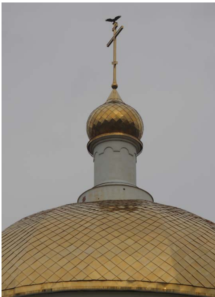
Автор Кирилл Таранов.

Ответ руководителя: - Плотина на Нижнем озере!