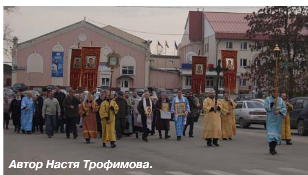
Автор Настя Трофимова.