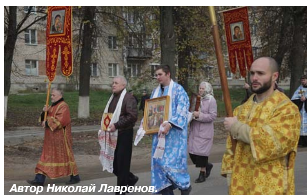
Автор Николай Лавренов.