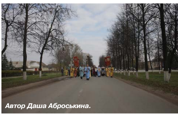
Автор Даша Аброськина.