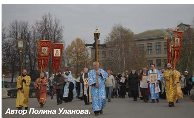
Автор Полина Уланова.