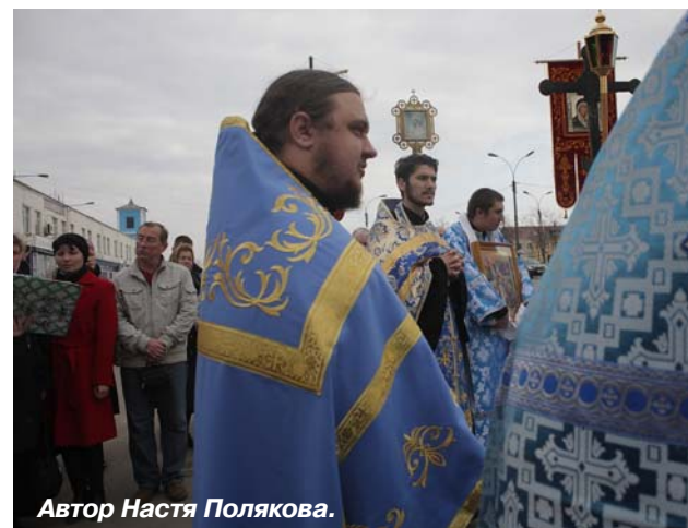
Автор Настя Полякова.