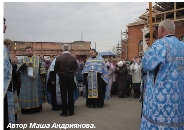
Автор Маша Андриянова.