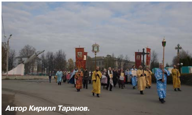
Автор Кирилл Таранов.