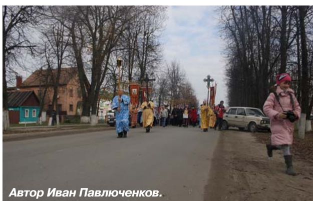
Автор Иван Павлюченков.