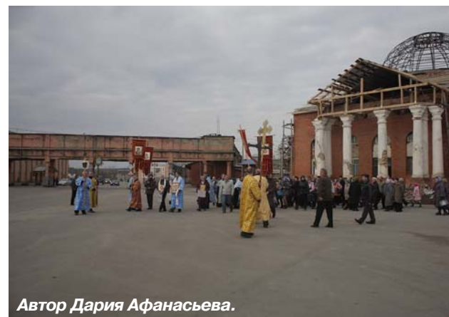
Автор Дария Афанасьева.