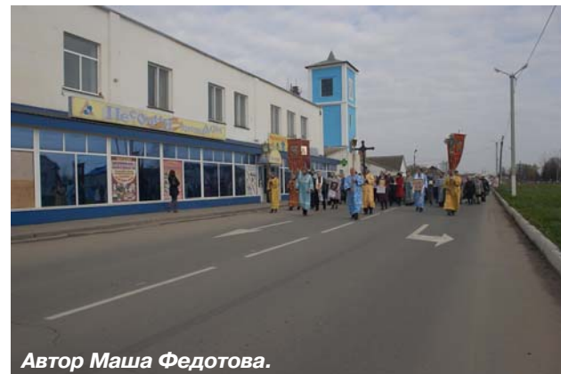
Автор Маша Федотова.