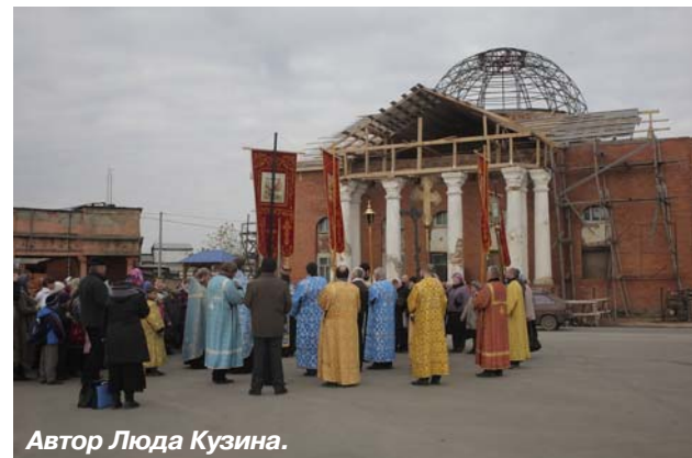
Автор Люда Кузина.