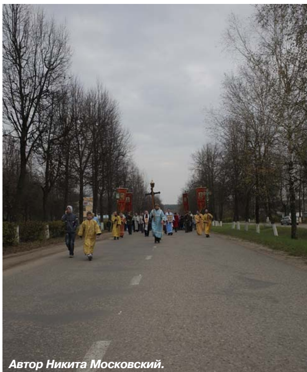
Автор Никита Московский.