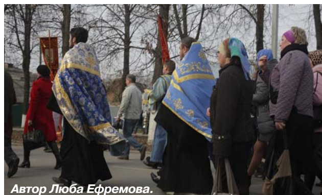
Автор Люба Ефремова.