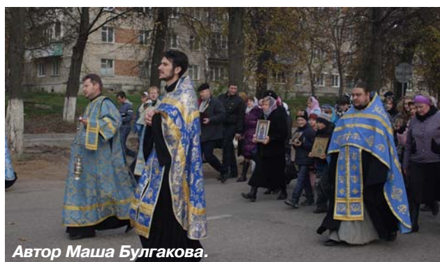
Автор Маша Булгакова.