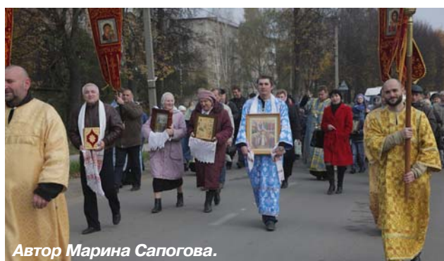
Автор Марина Сапогова.