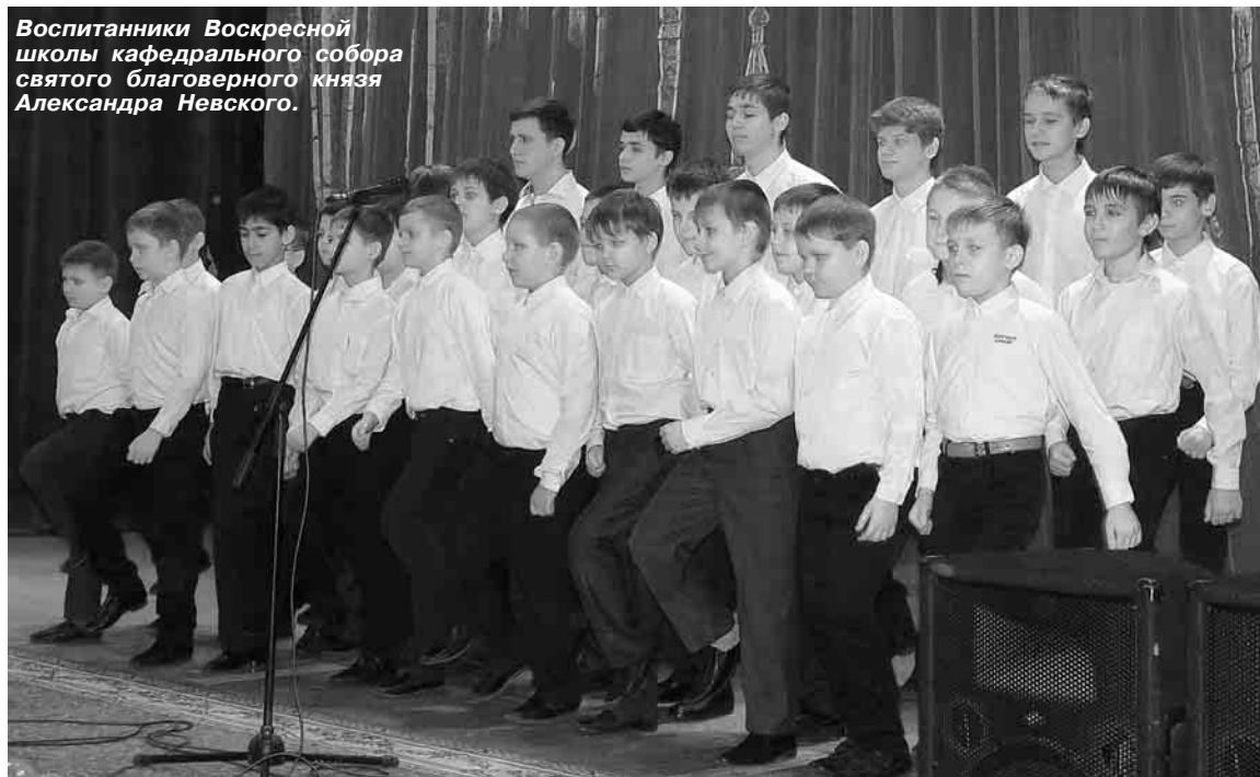
Воспитанники Воскресной школы кафедрального собора святого благоверного князя Александра Невского.