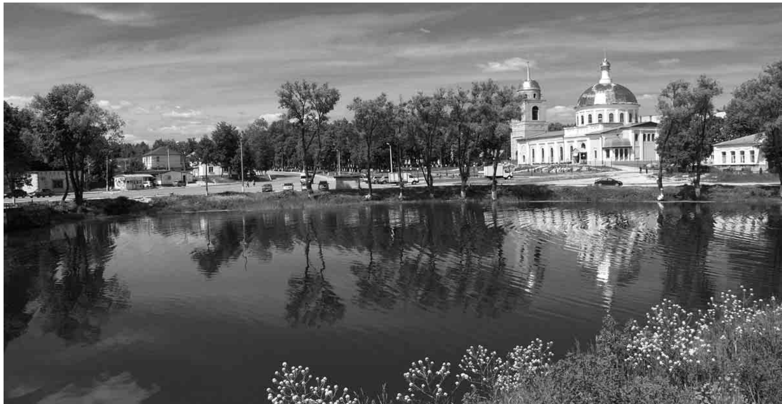
Кафедральный собор святого благоверного князя Александра Невского.