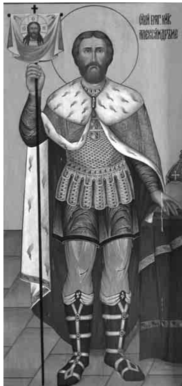
Икона святого благоверного князя Александра Невского.