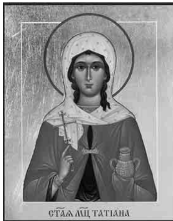
Татьяна покровительницей студенчества.

Так, 25 января (совпадает с окончанием экзаменационной сессии) и 7 мая (проходят Ломоносовские чтения) стали знаковыми днями для Московского Университета, а мученица