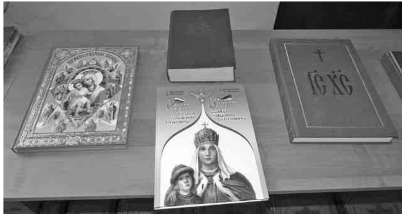
Вниманию участников была представлена выставка литературы духовно-нравственного содержания, среди которой можно было найти редкие экземпляры книгопечатания XVIII - XIX вв. и другие.

На базе отдела образования Кировской районной администрации прошло мероприятие, посвящённое Дню православной книги. Этот День ежегодно празднуется 14 марта. Тема праздничной встречи звучала так: «Влияние Священного Писания на развитие религиозной и светской литературы». В её обсуждении принимали участие преподаватели истории, основ православной культуры, русского языка и литературы, представители Воскресных школ и духовенства, а также работники культурно-просветительских и образовательных учреждений Песоченского благочиния.