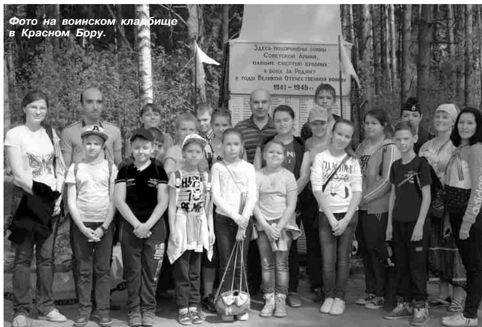
Фото на воинском кладбище в Красном Бору.