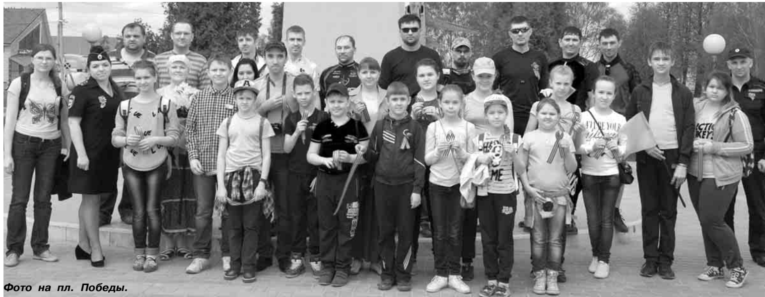
Фото на пл. Победы.

В Воскресной школе кафедрального собора святого благоверного князя Александра Невского прививают своим воспитанникам любовь к Родине, учат детей сохранять память о павших защитниках Отечества. Патриотическая работа ведётся через походы по «карте памяти», связанной с историей Великой Отечественной войны. В этом году ребята вместе со своими наставниками и представителями Кировской районной газеты «Знамя труда» посетили в общей сложности 30 памятных мест в черте родного города Кирова. Причём до каждого они дошли пешком и возложили цветы.