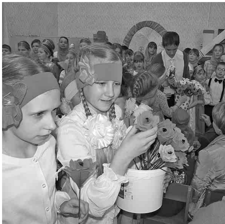
В Воскресной школе кафедрального собора святого благоверного князя Александра Невского совместными творческими усилиями воспитанников и наставников состоялся концерт, посвященный Великому Светлому празднику Воскресения Христова.

Пасхальное выступление детей пришли посмотреть их родители и прихожане Александр-Невского храма. В ходе концертной программы ребята с воодушевлением исполняли пасхальные стихи и песни, показывали театрализованные сценки, в которых славили воскресшего Христа Спасителя.