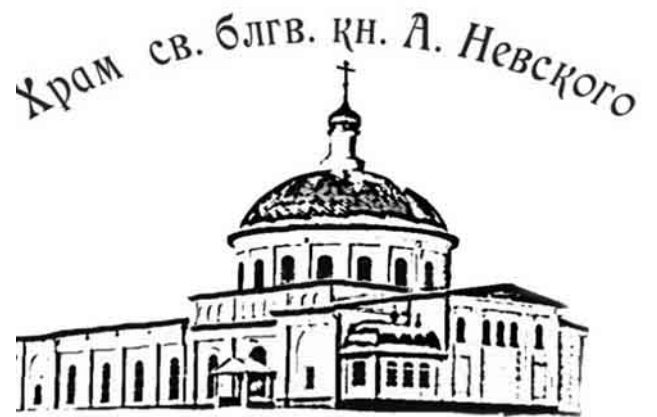
г. Киров Калужская область

13 июля, среда. Собор славных и всехвалых 12-ти апостолов. 8.00 Часы и Божественная литургия. 10.00 Панихида.