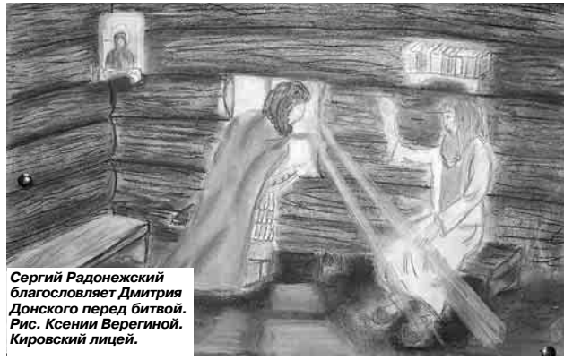
Сергий Радонежский благословляет Дмитрия Донского перед битвой. Рис. Ксения Берегиной. Кировский лицей.

1412 года, преподобный явился одному благочестивому мирянину и велел известить игумену и братии: «Зачем оставляете меня столько времени во гробе, землей покровенного, в воде, утешающей тело мое?». И вот при строительстве собора открыты и изнесены были нетленные мощи преподобного, и все увидели, что не только тело, но и одежды на нем были невредимы, хотя кругом гроба действительно стояла вода. При большом стечении богомольцев и духовенства, в присутствии сына Дмитрия Донского, князя Звенигородского Юрия Дмитриевича (+ 1425), святые мощи были изнесены из земли и временно поставлены в деревянной Троицкой церкви (на том месте находится теперь цер-